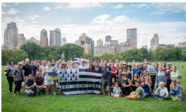
L'ASSOCIATION BZH New York déploie le Gwenn Ha Du dans Central Park.

Bien sûr, quand on pense au drapeau américain et français on voit tout de suite le rapport aux mêmes couleurs. Mais pour les Bretons du Nouveau Monde et les autres, la relation entre leur drapeau, le Gwenn Ha Du, et le drapeau américain est encore plus flagrante. Créé 1777 le drapeau américain a évolué au rythme de l'Histoire du pays. Tout d'abord constitué de 13 bandes représentant les 13 premières colonies et de 13 étoiles en forme de ronde pour les 13 premiers états, il trouve sa forme plus actuelle à mesure qu'un état rejoint la fédération et en 1960, toujours les 13 bandes et enfin les 50 étoiles après le ralliement de l'Alaska et d'Hawaï qui lui confère son aspect actuel.