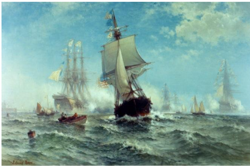
Edouard Moran, Première reconnaissance officielle du pavillon par un étranger , 1898.