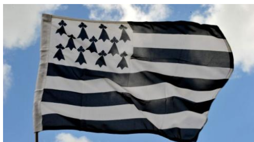
Gwenn Ha Du

Le drapeau breton a été imaginé en 1923 par Morvan Marchal, architecte et militant breton. Ce dernier s'est visiblement inspiré des drapeaux américains et grecs pour concevoir le Gwenn Ha Du (qui veut dire blanc et noir en breton). Mais d'autres préfèrent penser qu'il est adapté des armoiries de la ville de Rennes.