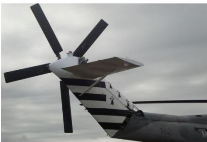
Gwenn Ha Du peint sur la queue d'un Super-Frelon de la flottille 32F

Donc finalement plus de druides, mais une évidente complicité avec le drapeau américain, sans la couleur, qui a fêté cette année ses 97 ans.